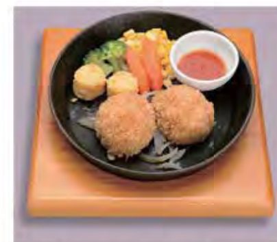
カニクリームコロケ Crab Cream Croquette . . . . 1000