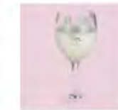
牛乳 飲むヨーグルト リンゴジュース オレンジジュース