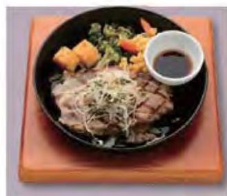
麦豚ステーキ 香味野菜添え (ポン酢) Pork Steak ..... 1000