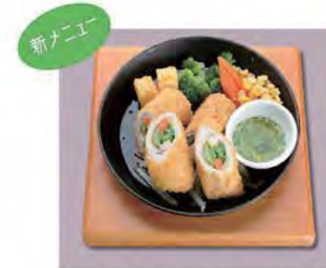
麦豚肉と彩り野菜のロールフライ Fried Pork & Vegetable Roll.....1000