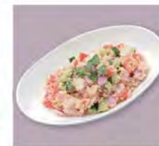
クスクスチキンサラダ Couscous Chicken Salad ..... 800