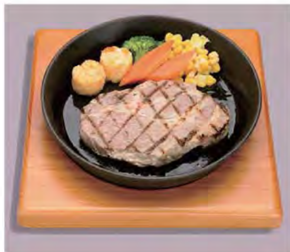
麦豚ステーキ (和風おろしソース) Pork Steak ..... 1000