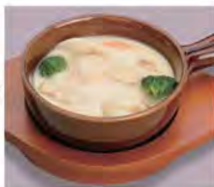
チキン フリカッセ Chicken Fricassee .....1000