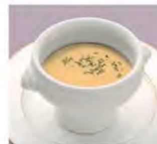
本日のスープ Today's Soup ..... 300