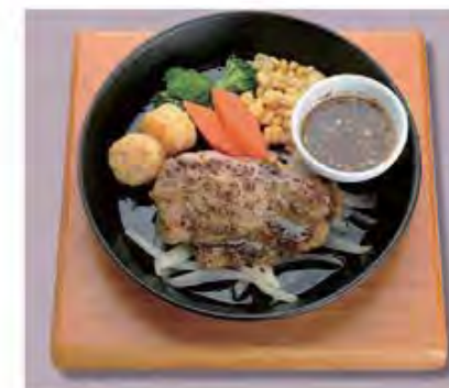
赤城鶏のソテー ハニーマスタード Chicken Saute ..... 1000