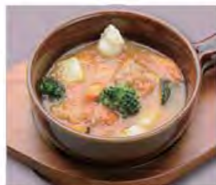
カチャトラ風 チキン煮込み Chicken Cacciatore .....1000