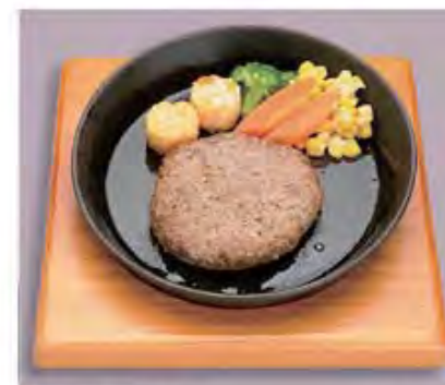
ハンバーグステーキ..... 1000 Hamburger Steak