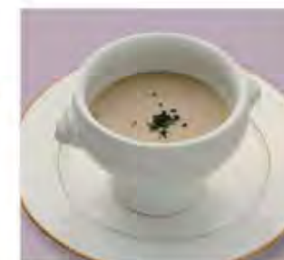
季節のスープ Season Soup ..... 300