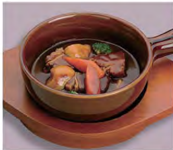
ビーフシチュー Beef Stew .....1300